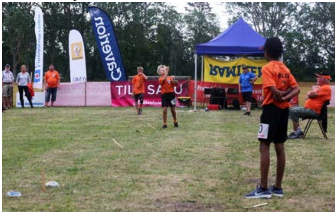
SM final Eksta Tomsarve 2019