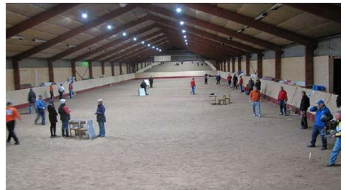
Mulde Ridhus Fröjel där vi kastar 3 tävlingar per år. Bilden från en tävling 2010 med direktsändning i Radio Gotland, Tävlingen hette 100,2