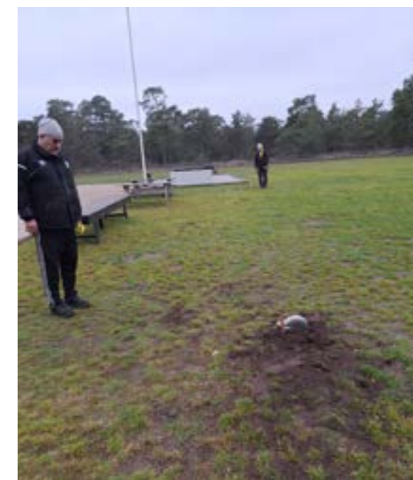
Sista varpa träningen i Rävheten var den 19 december 2025

Varpan har varit mycket aktiva på träningar i Rävheten, oftast två gånger i veckan och i bland även tävlingar på helgerna. Samt har vi varit med på många andra tävlingar under året.