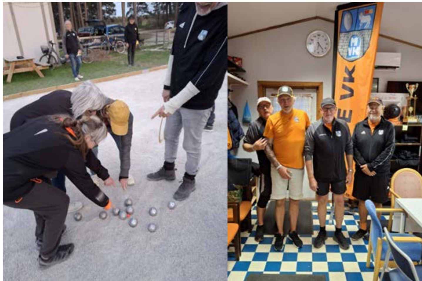
Bra spel där.